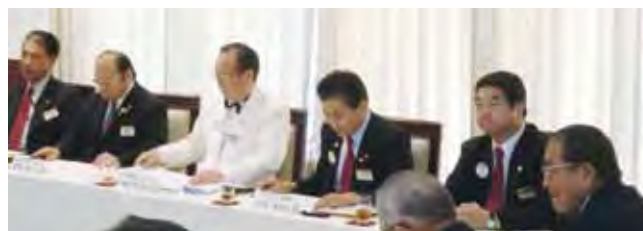
合同例会に先だって行われた諮問委員会の様子