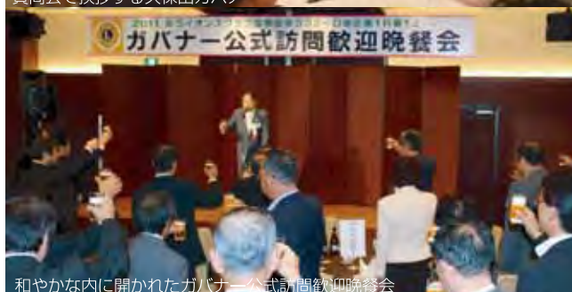
和やかな内に開かれたガバナー公式訪問歓迎晩餐会