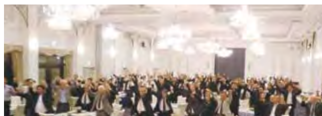
会員同士が団結しチャレンジを誓いライオンズローアがたのもしく会場に響きわたりました。