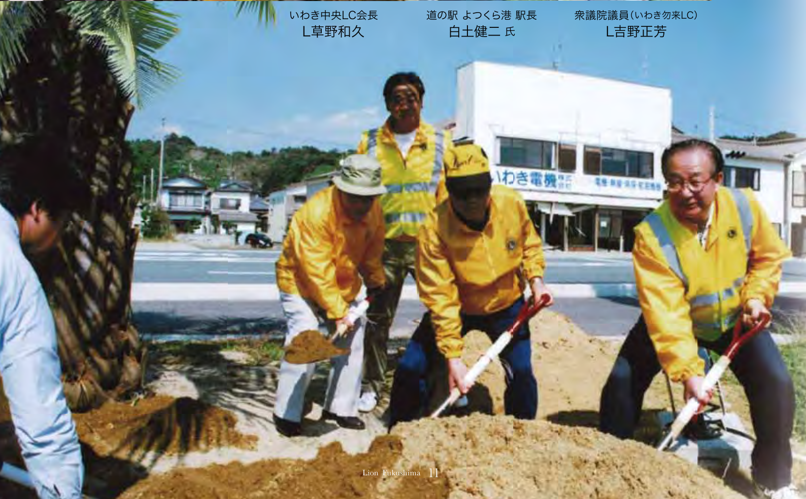
衆議院議員(いわき勿来LC) L吉野正芳