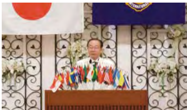
震災復興に向け力強くあいさつする久保田善九郎ガバナー