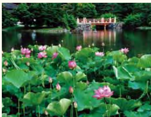
表紙写真「白水阿弥陀堂」