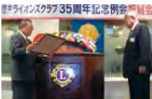
チャーターメンバーを表彰

例会終了後、アトラクションの大正琴の演奏を聴きながら、賑やかな楽しい祝賀会になりました。