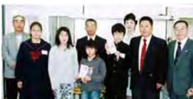
写真／富岡第一小学校 第二小学校 第一中学校 第二中学校