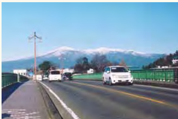
表紙写真「昭代橋(しょうだいばし)より見る安達太良山」

下舟場というこの地にコンクリートの橋が出来たのは昭和になってからのこと。それで昭代橋と名付けられたそうです。現在ある橋は昭和60年(1985)に完成総工費16億円をかけて造られました。この橋の歩道には、フランス・パリにある橋を真似て3箇所に物見ランカンがついています。ここから観る冬の安達太良山は絶景です。安達太良山は、万葉集に歌われており、歌の北限であると言われていました。三首あるうちの一つを紹介いたします。