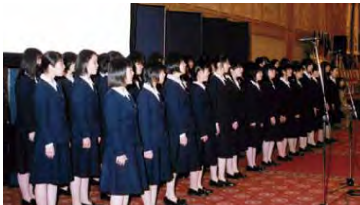
写真上 / 安積黎明高等学校合唱団 写真左上 / 郡山市立郡山第二中学校管弦楽部 写真左中 / 極真会館安斎道場 写真左下 / フラダンス