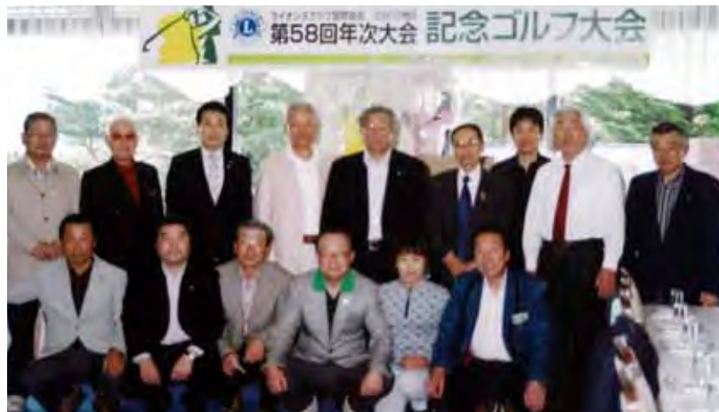
▲ 「記念ゴルフ大会」担当クラブの郡山東LCの皆様