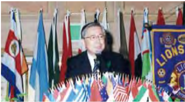
▲ 福島県知事 佐藤雄平様

未曾有の大震災後のことだけに式辞を述べる方も聞く会員も真剣な眼差しから万感新たに襟をたたく雰囲気を感じさせた。また、ライオンズクラブの日ごろの成果を新たに自覚し、更なる精進を自覚させた祝辞だった。