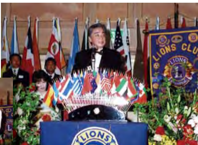
▲ 挨拶されるガバナーエレクト 杉本二十士