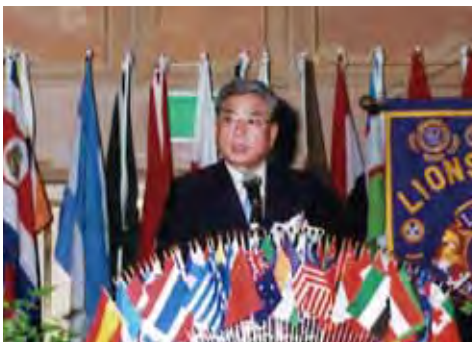
▲ 郡山市市長 原正夫様