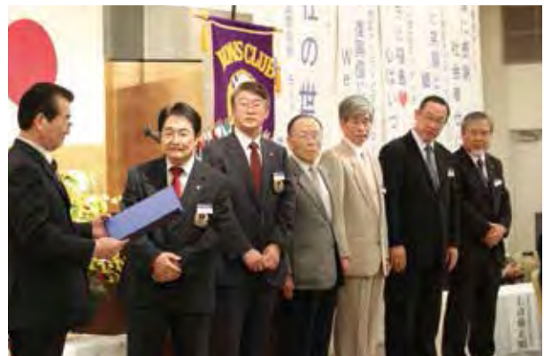
チャーターメンバーを表彰

また、記念アクティビティとして、秦野あづまライオンズクラブと友好クラブ関係を締結、パンダハウスを育てる会の支援、余目一輪車クラブスポーツ少年団の活動支援、福島おおなみ学園の秋の文化祭支援を行いました。記念例会に続いて祝賀会も開かれ、余目一輪車クラブスポーツ少年団の世界一の技の披露、ラッキーカードの抽選など、なごやかな中に出席者は親睦を深め合い、発展を誓い合いました。