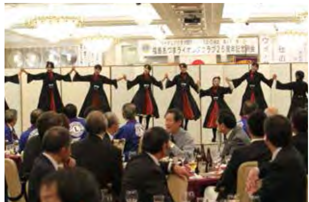
世界一の技を披露した「余目一輪車クラブスポーツ少年団」