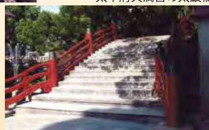
太宰府天満宮の太鼓橋