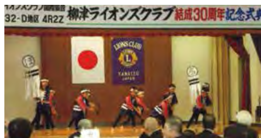
アトラクション「火消し」柳津保育所園児