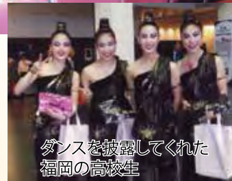
ダンスを披露してくれた 福岡の高校生