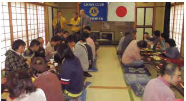
おいしいソバをいただく施設利用者の皆さん

本宮市知的障害者施設「すばる」大玉村知的障害者施設「フレンドリーおおたま」の施設利用者80人を本宮ライオンズ会員が打つ「手打ちソバ例会」に招待。招待者・会員・ネス・お手伝いの関係者が「挽きたて、打ちたて、茹でたて」の三たてソバを満喫。毎年開催し、利用生が心待ちにしているソバ例会は今回で15回目となります。