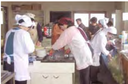
ソバ例会の準備に大忙しのネスの皆さん