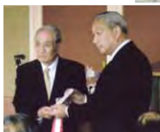
十文字会長に支援金を贈呈するL瀬谷会長(右)