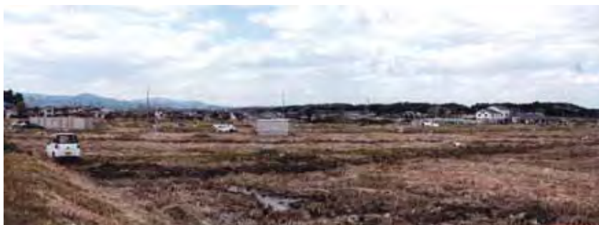
↑ 津波をかぶった田んぼと放置されている車両(小高区)