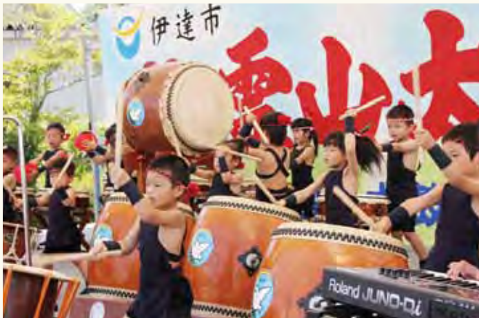
表紙写真「霊山太鼓まつり」

伊達市霊山町で毎年8月に霊山こどもの村を会場に開催される「霊山太鼓まつり」は、28年の伝統があり、雷鳴のごとく大地を揺るがし多くの観衆を魅了してまいりました。