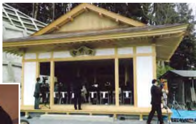
復旧新築された安珍堂