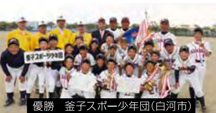
優勝 金子スポーツ少年団(白河市)