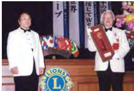
ガバナーキーの引継ぎ