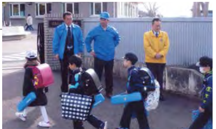
金谷川小学校の校門の前

新学期が始まる4月9日と10日に、松川地区内4小学校において、「朝の挨拶運動」を行いました。継続事業の一つですが、今年で30年目になります。松川駅の正面には、大きく「あいさつの駅」と標示してあります。当クラブは、青少年健全育成を第一に掲げており、大きな声で返事が返ってくるとうれしいものです。