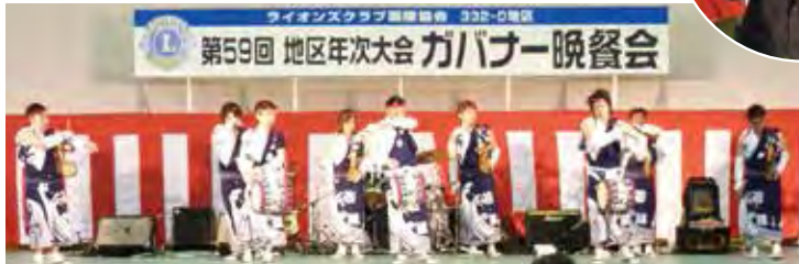
▲地元の「じゃんから踊り」で、おおいに盛り上がり