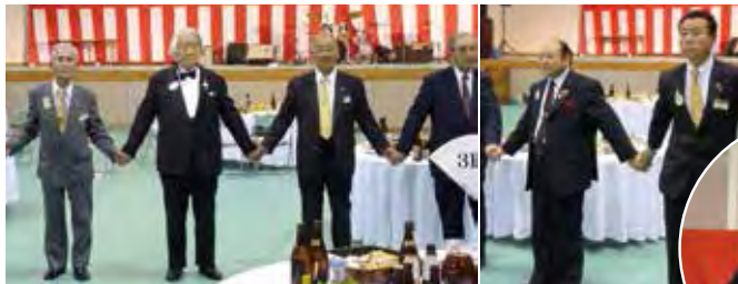
▲みんなで「また会う日まで」を合唱