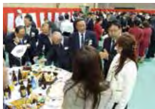
▲楽しい会話とおいしい料理