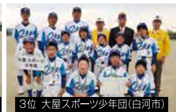
3位 大屋スポーツ少年団(白河市)