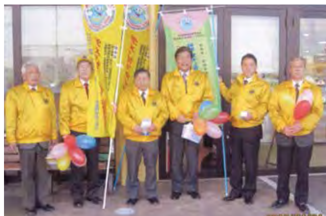
ヨークベニマル館町店店頭にて

4月4日(木)本宮駅とヨークベニマル館町店店頭に於いて、福島県北保健所より提供して頂いたのぼりを使用し、ティッシュペーパー・風船等を市民に配りながら「ダメ。ゼッタイ。薬物乱用防止」を参加会員でアピールした。