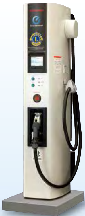
電気自動車用急速充電器