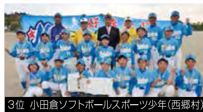
3位 小田倉ソフトボールスポーツ少年(西郷村)