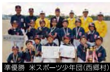
準優勝 米スポーツ少年団(西郷村)