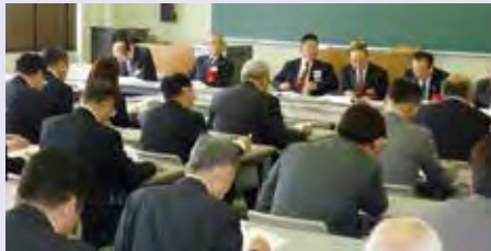
代議員分科会の様子