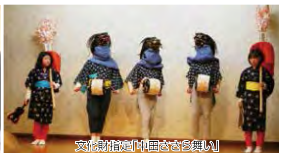
文化財指定「中田ささら舞い」