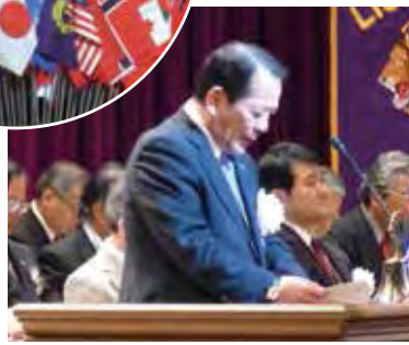
いわき市長 渡辺 敬夫様