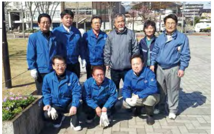
花植え終了後、フラワーポットの横で

4月13日(土)福島市の新浜公園で花植えを行いました。公園内に設置した10個のフラワーポットに、ペチュニア、ミムラス、スカビオサなどの花苗約100ポットを植えました。フラワーポットを寄贈して以来、毎年2回行っている継続事業です。