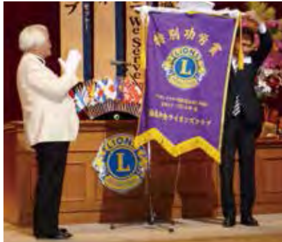
特別功労賞を頂いた福島中央LC