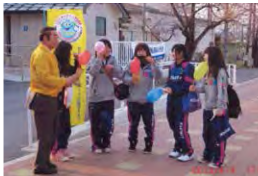
落合会長と女子高校生たち