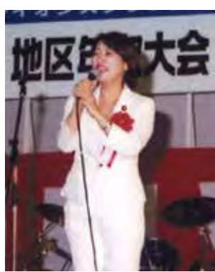
参議院議員 森 まさこ様