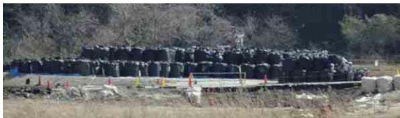
▲南相馬市小高区西部地区の放射性物質の除染作業の様子(車窓より視察)