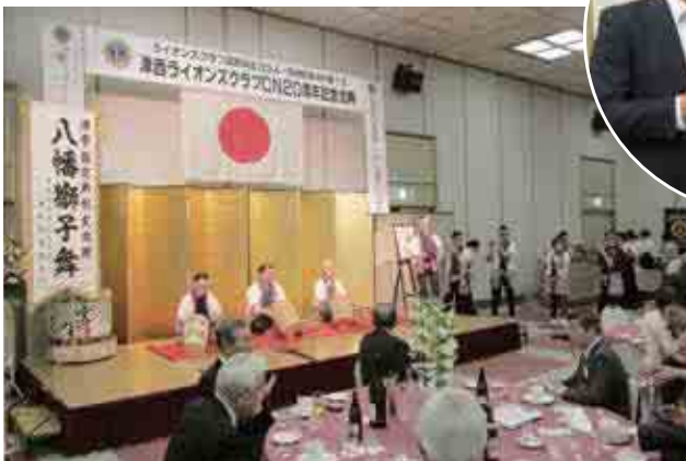
▶アトラクション 「アトラクション 「八幡獅子舞」