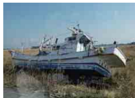
▲農地には、船がそのまま