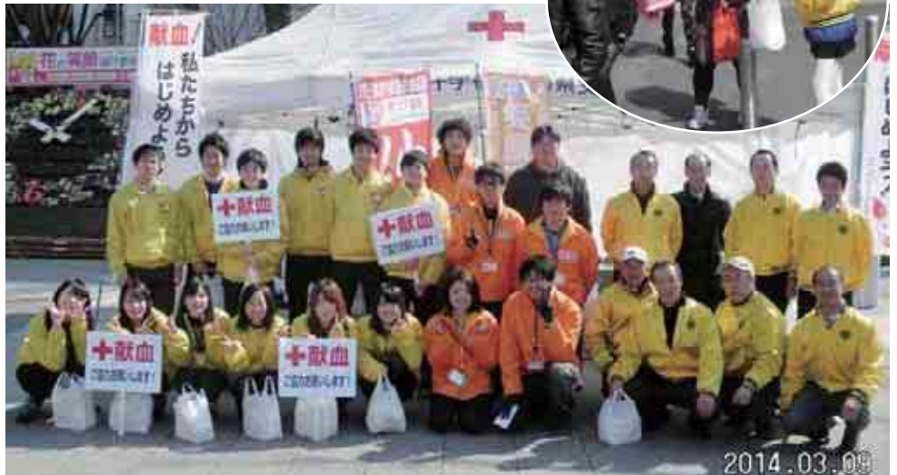
福島大学・福島学院大学・埼玉県の学生ボランティアの皆さんと一緒に街頭献血の呼びかけをしました