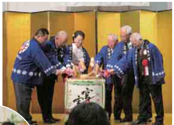
▲郡山西・津西、他来賓の鏡開き