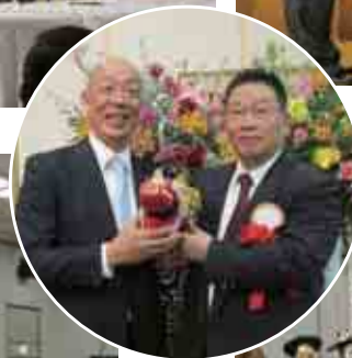
◀津西LCに会津「赤べこ」をプレゼント