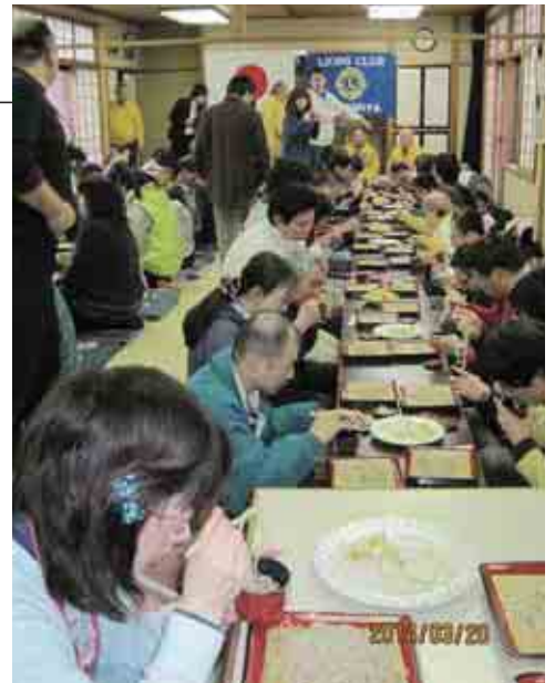
▲みんなで美味しいソバを頂いています。