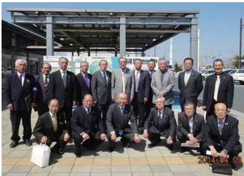
▲視察前の記念撮影

第一原発の様子は毎日マスコミで取り上げられているが、原発の影響の為に町の復興が進んでいない事はあまりニュースになっていないのが残念、ライオンズの皆様も是非その辺をPRして欲しいとの事でした。