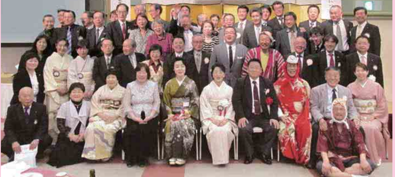
▲郡山西・津西ライオンズクラブ記念写真

去る3月29日(土)、三重県津市・津都ホテルにて、334-B地区 4R・1Z津西ライオンズクラブと姉妹締結をいたしました。津西ライオンズクラブとのご縁は、先の大震災によってもたらされたものです。それまで伊勢湾台風災害などの被災の歴史や、阪神淡路大震災での奉仕活動の経験で、初動の迅速さの重要性から、いち早く同じ「西」の字を冠する当クラブへの連絡を下さったというのが、そもそものいきさつでした。三年間に渡り50万円ずつ3回、