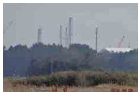
▲第一原発が7km南に見える