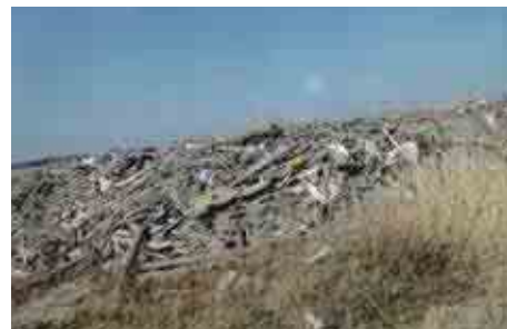
▲ガレキの山は、片づけられず