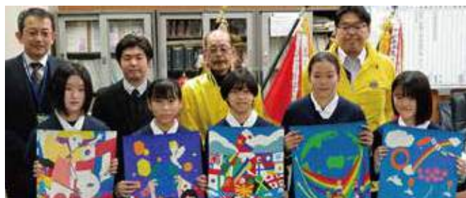
▲真受賞されたみなさん、おめでとうございます!