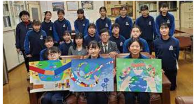
▲受賞者3名と清水中の皆さん