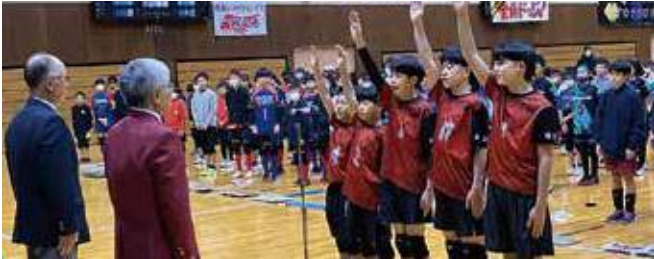
▲選手宣誓と試合風景