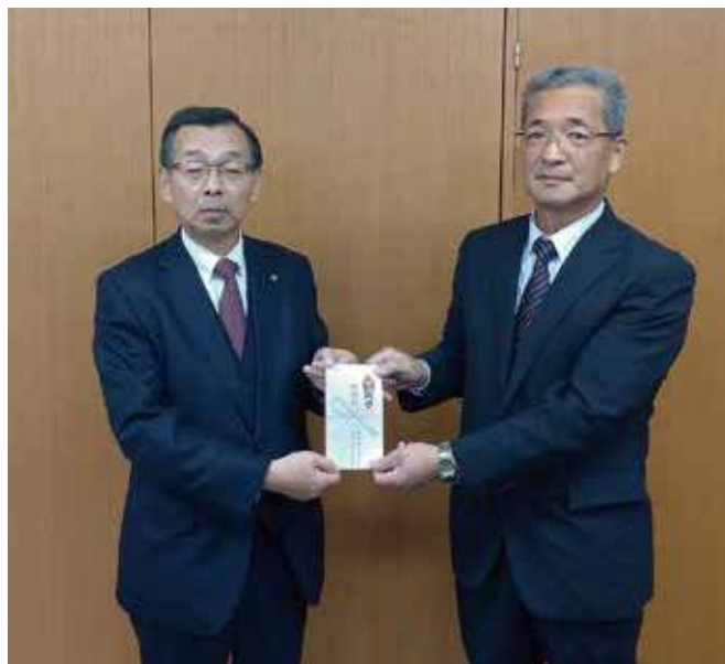
▲天栄村社会福祉協議会へ寄付金の贈呈