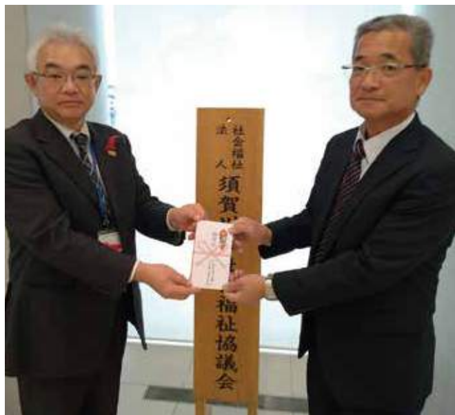
▲須賀川市社会福祉協議会への寄付金の贈呈