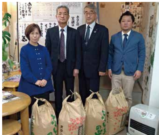
▲子ども食堂へ精米を届ける