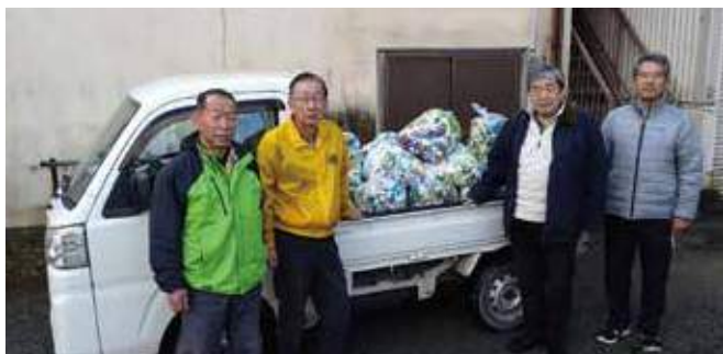
▲積み込み作業終了後。