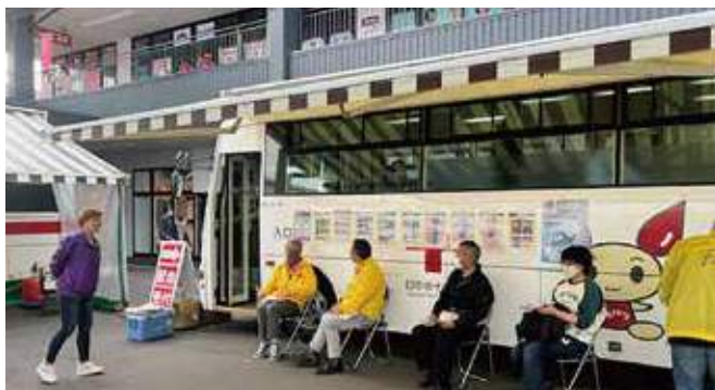
▲献血の呼びかけと共にアイバンク登録啓発も行う様子