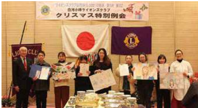
▲受賞者との記念撮影