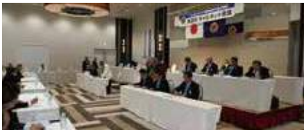
▲第2回キャビネット会議