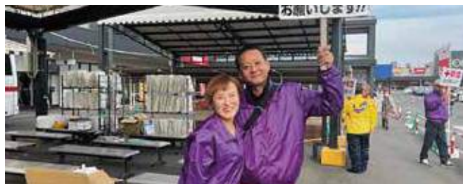
▲献血の呼びかけと共に骨髄バンクの登録啓発も行う様子