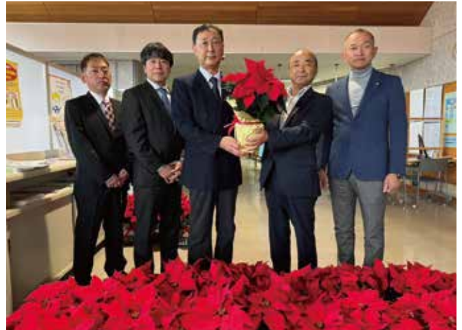
▲三役、事業委員長が施設長にポインセチア贈呈している