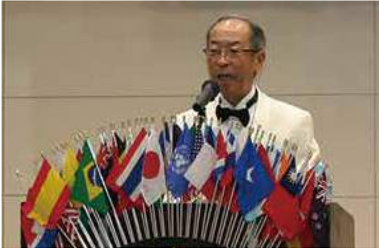
▲地区ガバナーL門馬弘