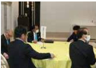
▲正副委員長会議 (青少年育成・LQ・平和ポスター委員会)