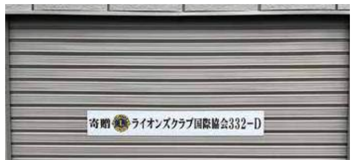
▲いわき市四倉町へストックヤード設置

台風13号による豪雨災害支援物資として寄贈した備品の保管庫として、災害復旧用器具資材保管倉庫(ストックヤード)1棟をいわき市社会福祉協議会様へ贈呈しました。