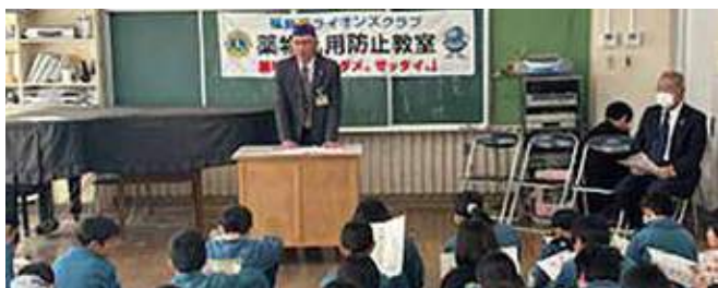
▲福島市立庭坂小学校での薬物乱用防止教室