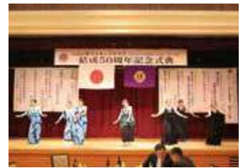
▲フラダンスショー

11月19日(日)白河小峰ライオンズクラブ結成50周年記念式典を「JA夢みなみセレモニープラザ」にて行いました。