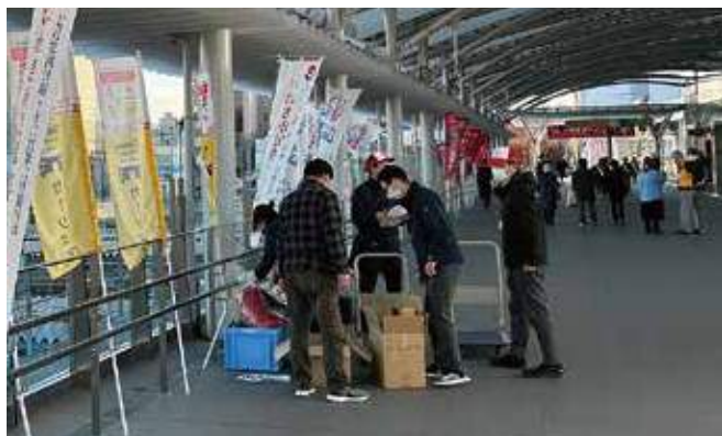
▲いわき駅南口駅前広場