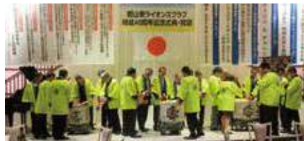
▲祝宴 鏡開き 来賓総勢28名