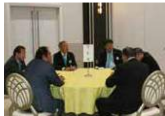
▲正副委員長会議 (YCE委員会)