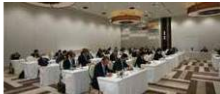
▲第2回キャビネット会議