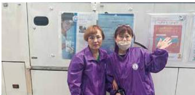
▲献血の呼びかけと共に糖尿病予防啓発も行う様子