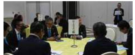
▲正副委員長会議 (PR・ITライオンズ情報委員会)