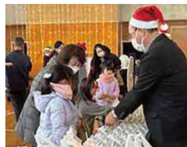
▲クリスマスパーティー