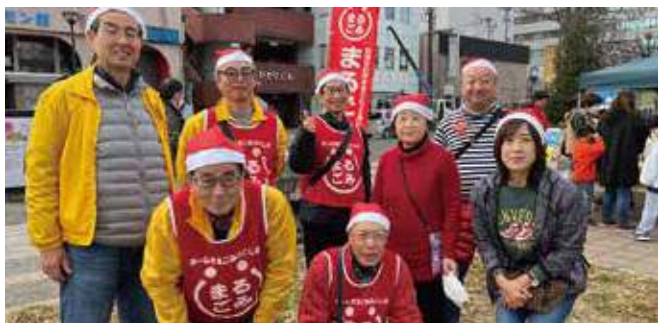
▲サンタ帽子を被って活動しました