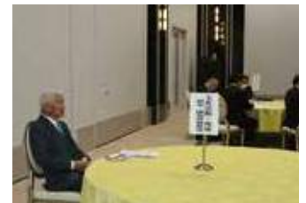
▲正副委員長会議 (文化活動・環境・献血・機器移推進)

第2回キャビネット会議が11月22日、南相馬市「ホテル丸屋グランデ」で開催されました。