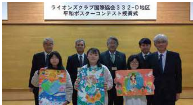
▲平和ポスター作品と受賞者の児童