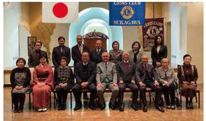
▲終了後会員皆様と撮影