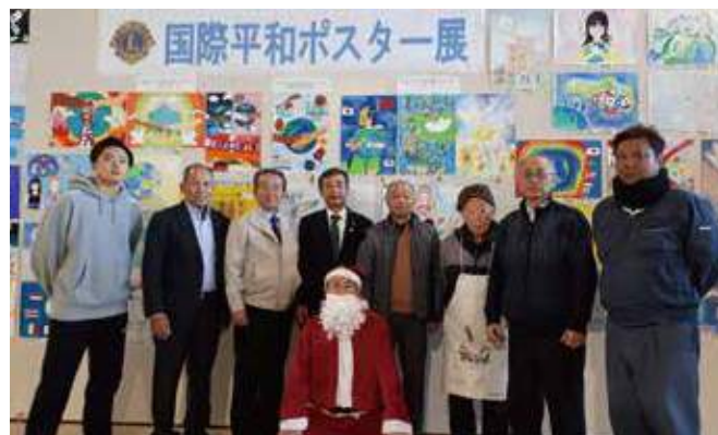
▲展示したポスターの前で