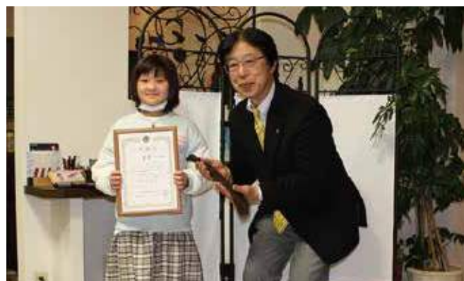
▲ヘアドネーションを受け取るL田畝会長