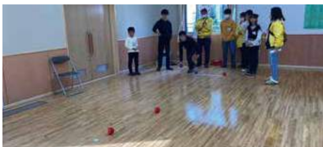
▲ねらったところへ…、それっ!

令和5年11月23日(木) 9時~13時30分 これまで37年にわたり続けている青葉学園のみなさんとの交流会を開催しました。 前回に引き続き、今回も2020年東京パラリンピック競技である「ボッチャ」で交流しました。ボッチャは、性別や障がいの有無にかかわらずすべての人が一緒に競い合えるスポーツです。子どもたちと会員は12チームに分かれて、熱戦を繰り広げました。 ボッチャで対戦したあとは、「焼肉きんぐ」で焼肉食べ放題の昼食。子どもたちの食欲にノックアウトされつつ元気で満たされる一日になりました。