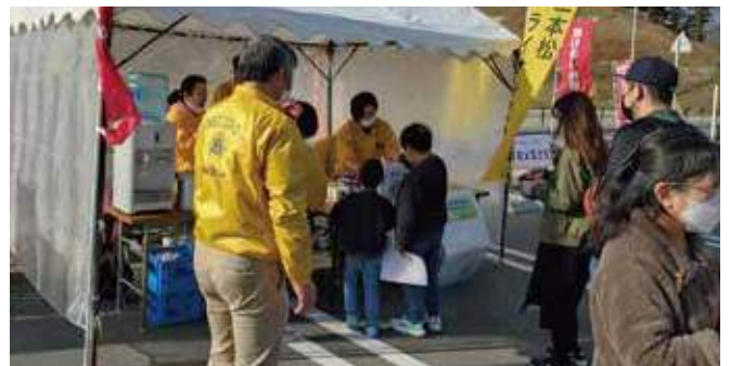
▲家族連れからの募金