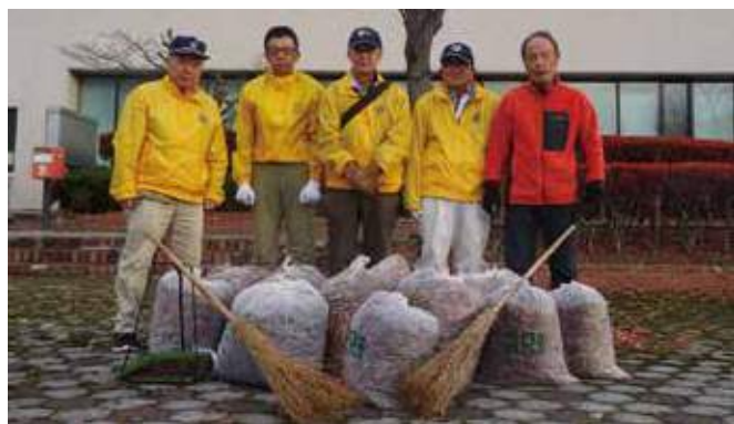
▲落ち葉拾いの成果