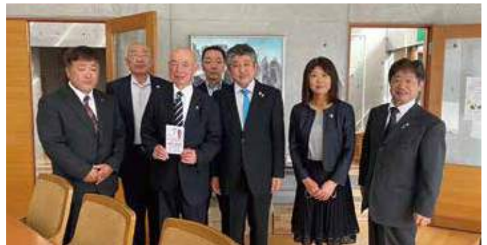
▲2023年10月27日(金) 福島県立大笹生支援学校 支援金贈呈 いわき市豪雨災害被災地 支援金協力