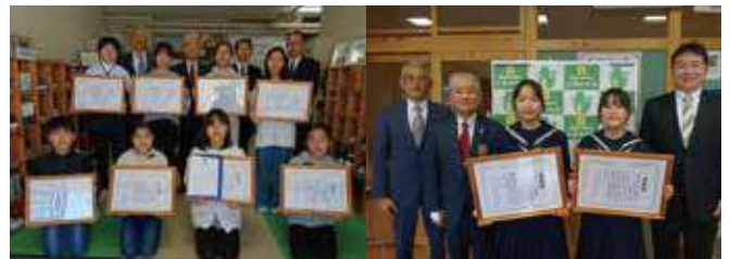
▲小野小と小野中の受賞者