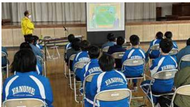
▲真剣に学ぶ矢野目小学校の子どもたち