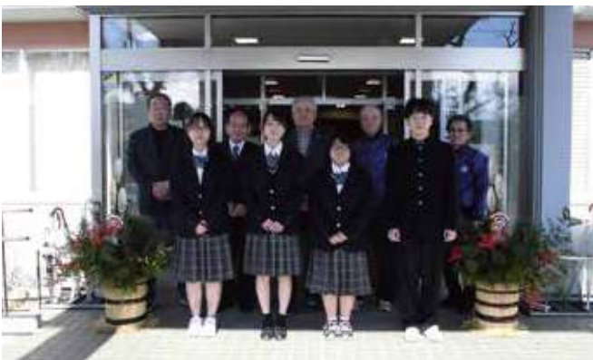
▲生徒たちと贈呈時に撮影