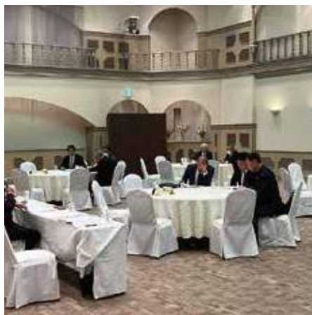
▲第2Z諮問委員会の様子