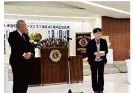
▲記念事業目録贈呈