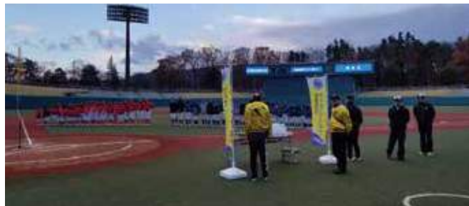
▲すばらしい試合でした。おつかれさまでした!