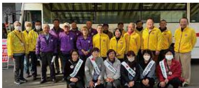
▲郡山中央LC・郡山北LC・骨髓バンク郡山支部様・赤十字奉仕団様との集合写真