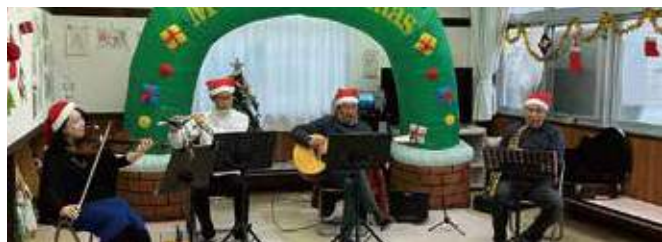
▲サンタとトナカイ登場・生バンド演奏