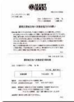
▲2023年10月3日 いわき市豪雨災害被災地 支援金協力