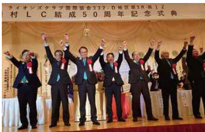
▲ライオンズ・ローア