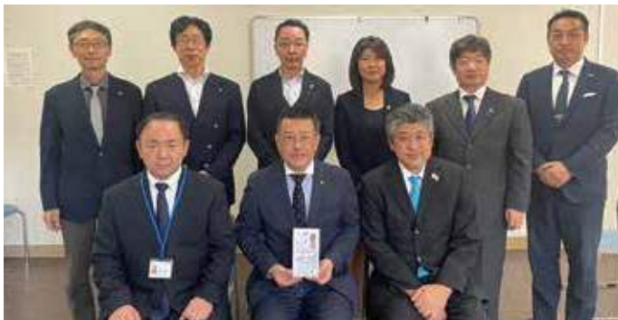
▲2023年10月19日(木) 社会福祉法人福島愛育園 支援金贈呈 いわき市豪雨災害被災地