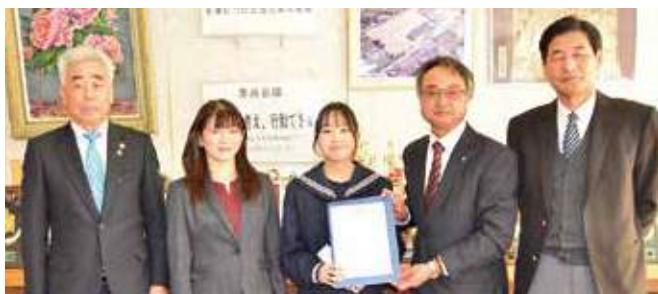
▲国際平和ポスターコンテスト第6R第2ZC賞表彰状贈呈