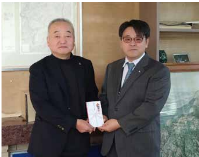
▲歳末助け合い募金を贈呈