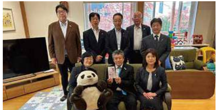
▲2023年10月19日(木) 認定NPO法人パンダハウスを育てる会 支援金贈呈