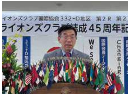
▲須田博行伊達市長による来賓祝辞