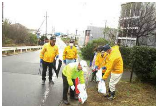
▲矢吹町内の清掃活動