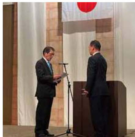
▲ニューメンバー修了書授与