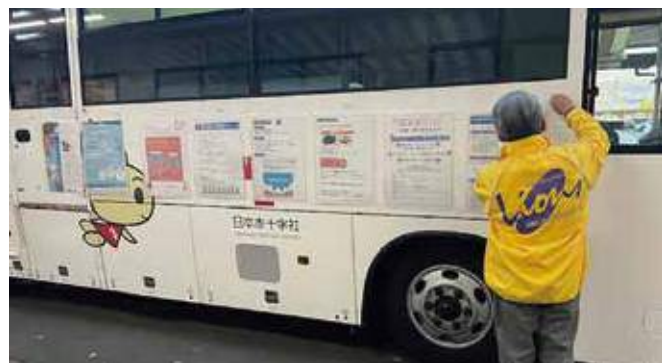
▲献血の呼びかけと共にヘッドネーション啓発を行うために掲示の準備の様子