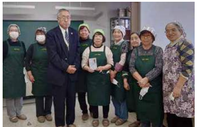
▲子ども食堂への支援