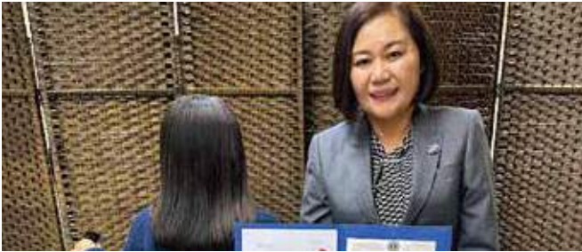
▲さくらちゃんとL千葉FWT委員長