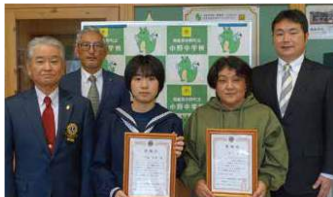
▲ヘッドネーションの提供者