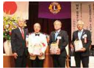
▲キャビネット三役へ記念品贈呈