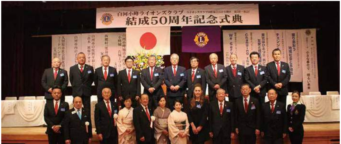
▲全会員集合記念撮影