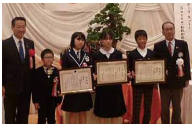
▲標語・ポスター受賞者

11月18日(土)船引町の迎賓館辰巳屋において「田村ライオンズクラブ結成50周年記念式典」が開催され、会員らが奉仕活動の進展を改めて誓い合いました。