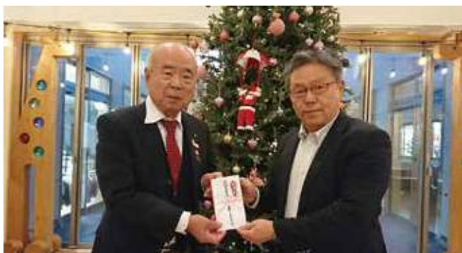
▲学校法人まゆみ学園古渡理事長に贈呈