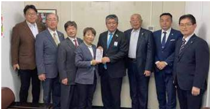
▲2023年10月13日(金) チャイルドラインふくしま 支援金贈呈 いわき市豪雨災害被災地