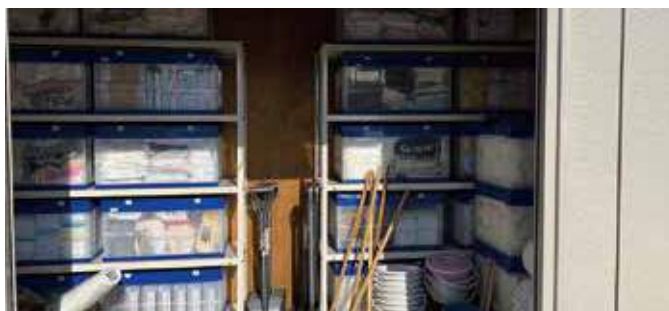
▲いわき地区ストックヤード