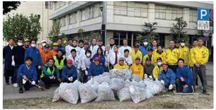
▲2023年11月11日(土) 福島市内清掃活動