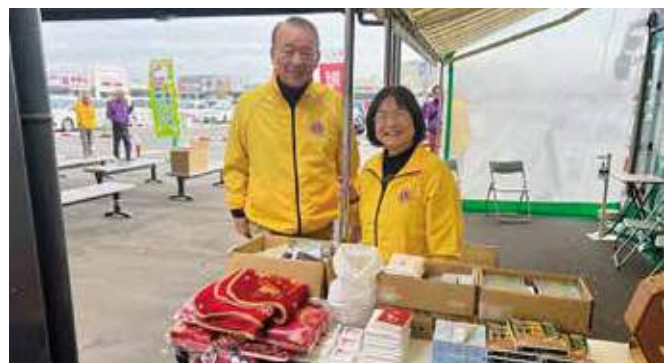
▲献血協力者の皆様への抽選会担当のL市川・L酒井