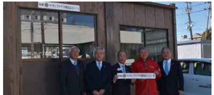
▲いわき市社会福祉協議会様へ贈呈したストックヤードの前で