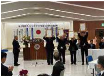
▲チャーターメンバー及び歴代会長への感謝状贈呈