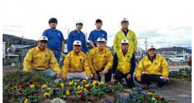
▲植栽後の集合写真

令和5年11月24日(金) 11時~12時 JR磐越東線小野新町駅構内へ環境美化活動の一環として、駅乗降場所への花の植栽事業を実施しました。この事業は、駅利用者へ花を鑑賞することで心を癒してもらおうと年2回実施しているもので、当日は丹精込めて育てた小野高校の生徒や担当教諭にも手伝いいただき、クラブのメンバーとともに3か所の花壇に赤・黄・青・紫色の鮮やかなパンジー300本を植栽しました。