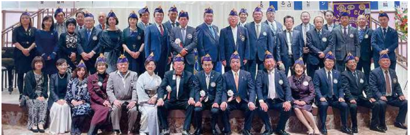
▲郡山東LC会員出席者集合写真