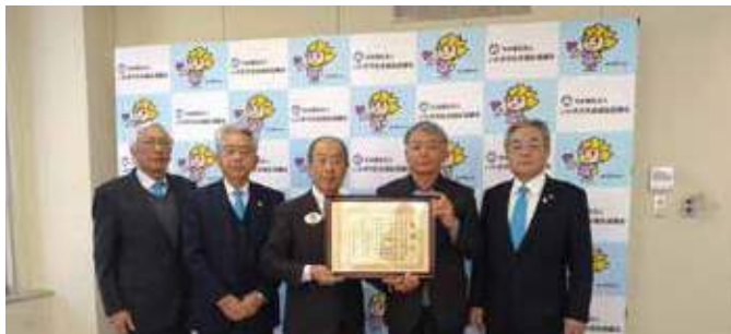
▲感謝状をいただきました