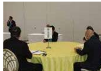
▲正副委員長会議 (中期改革・大会参加・薬物乱用防止委員会)