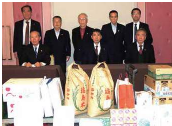
▲子ども食堂運営支援品