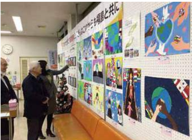
▲福島銀行福島南支店ロビーへ作品展示