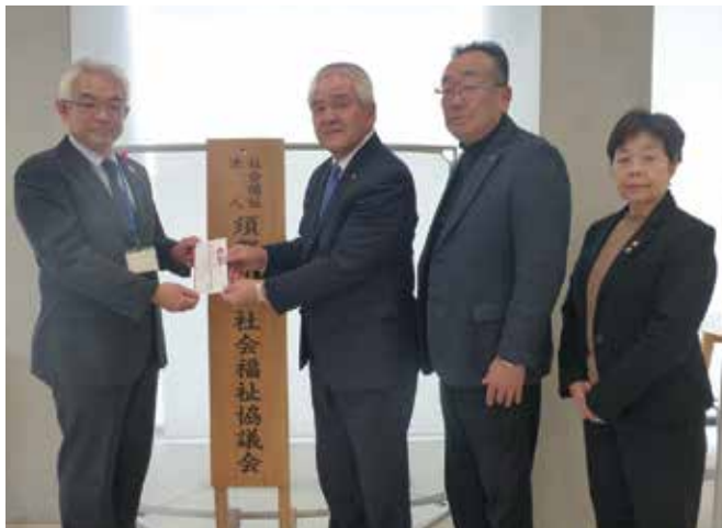
▲募金の贈呈時に撮影