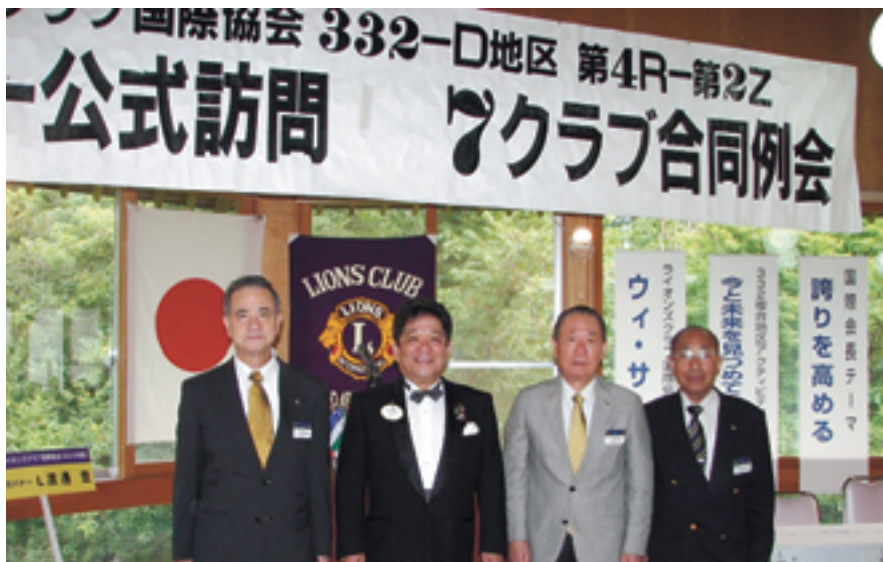
▲左からL宮城第1副地区ガバナー、L渡邊ガバナー、L中島名誉顧問、L橋谷田 4R・2Z・ZC