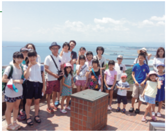
▲マリントワー大パノラマ展望台にて 参加者