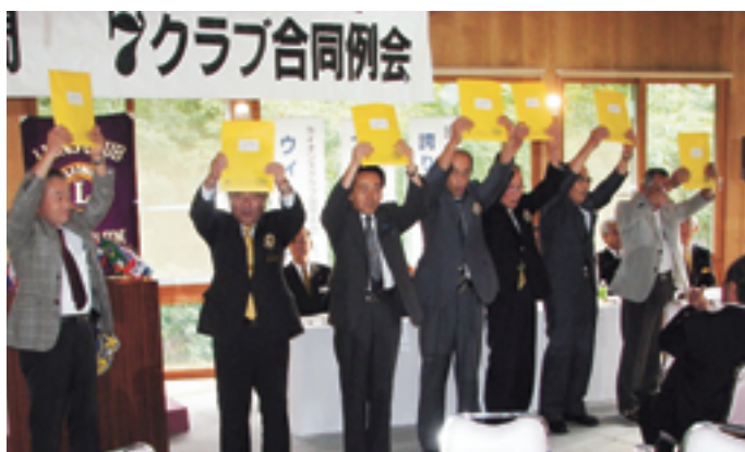
▲ガバナーよりフクラブに記念品が贈呈されました

【開催場所】西会津町温泉健康保養センター ロータスイン 質問会 15時〜 / 合同例会 16時10分〜