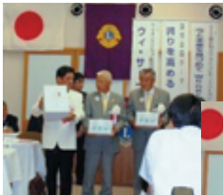
▲三役へ記念品贈呈