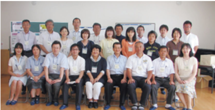
喜多方会場に参加した皆さん