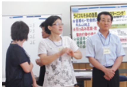
上田副委員長も皆と一緒に・・・。