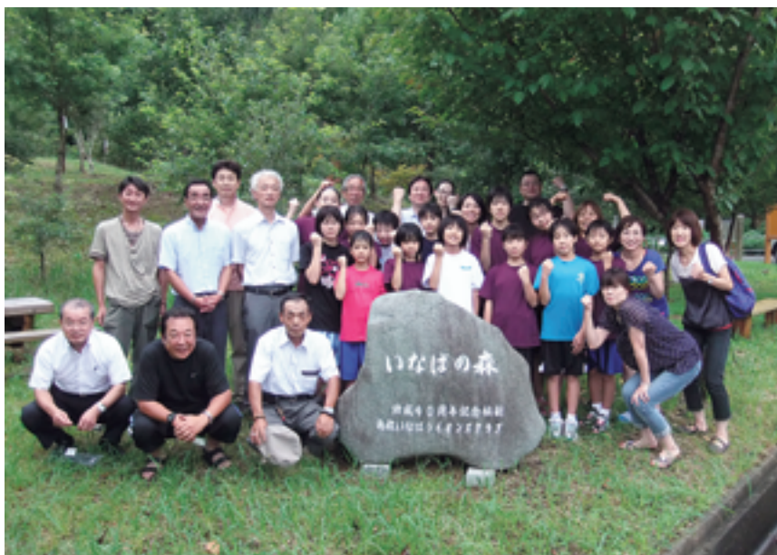
▲「いなばの森」記念碑の前で記念撮影

平成26年8月14日～17日、今年度青少年育成事業の1つとして、姉妹クラブでもある鳥取いなばLCからの招待を受け、合同アクティビティとして第6回FML西日本ミニバスケットボール大会(参加16チーム)に郡山市のF・Kあさかミニバスケットボールスポーツ少年団女子チーム(安積第1小、永盛小、高瀬小合同チーム)を派遣しました。選手13名、監督、コーチ、父兄、当クラブ会員の総勢25名での13時間のバス移動でしたが、子供達は2日間にわたり元気にプレーし他県の選手との交流で多くの事を学んだ事と思います。最終日には「鳥取砂丘」「とっとり出会いの森」の中にある鳥取いなばLCの記念碑等を見学し帰路につきました。