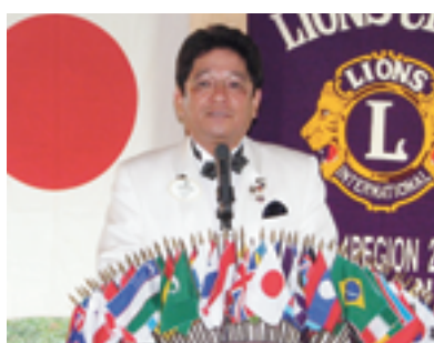
▲ガバナーのあいさつ

ゾーン・チェアパーソンL橋谷田征喜のあいさつ、クラブ三役の紹介が行われたあと、ガバナーから基本方針・重点目標の説明があり、質問会に入りました。