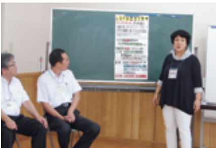
中村先生の楽しい会話がはずんで！