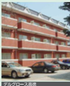
テルグロース高德