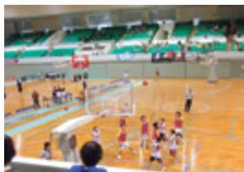
試合中のF・Kあさかの選手達