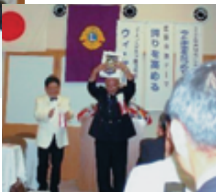
▲アワード贈呈の様子