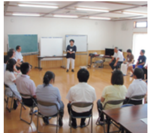
楽しかったワークショップ