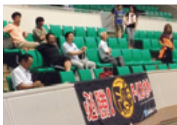
▲応援する会員及び父兄